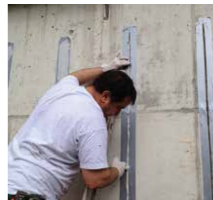
2 Eingeschlitzte S&P C-Lamine (Biegung)