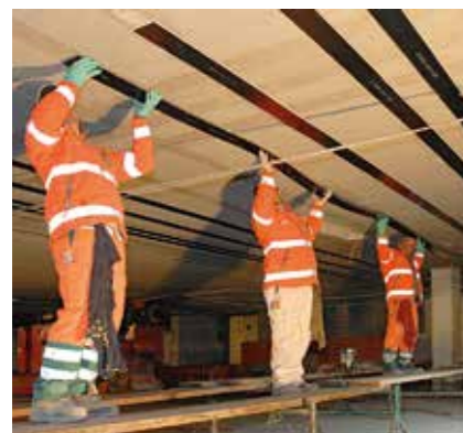
1 Oberflächlich schlaff geklebte S&P C-Lamine (Biegung)