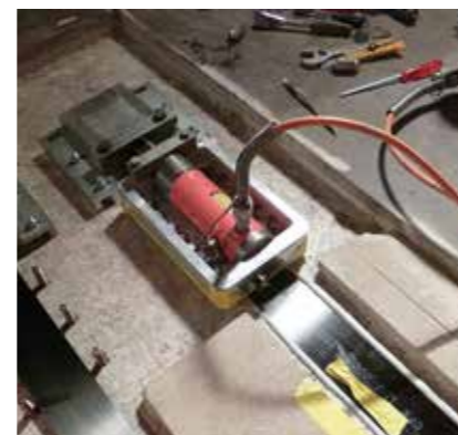
3 Vorgespannte S&P C-Lamine (Durchbiegung)