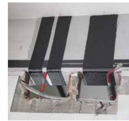
4 Unterzug mit S&P C-Sheet 640 (Querkraft)

Besuchen Sie unsere Homepage www.sp-reinforcement.eu für weitere Informationen: Referenzen/Technische Datenblätter/Ausschreibungstexte/Untersuchungsberichte/Publikationen