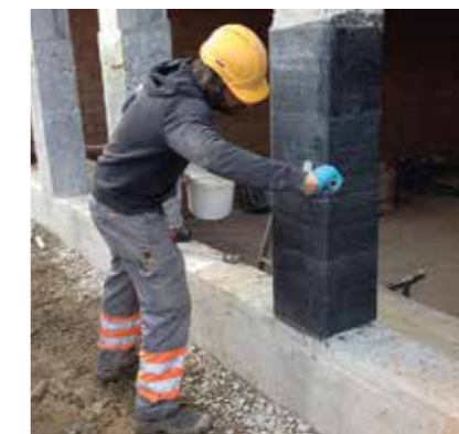
5 Stütze mit S&P C-Sheet 240 (Normalkraft)