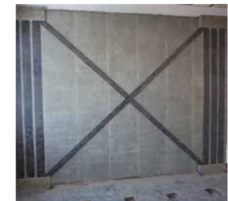
6 Mauerwerksverstärkung mit S&P G-Sheet (seismische Verstärkung)